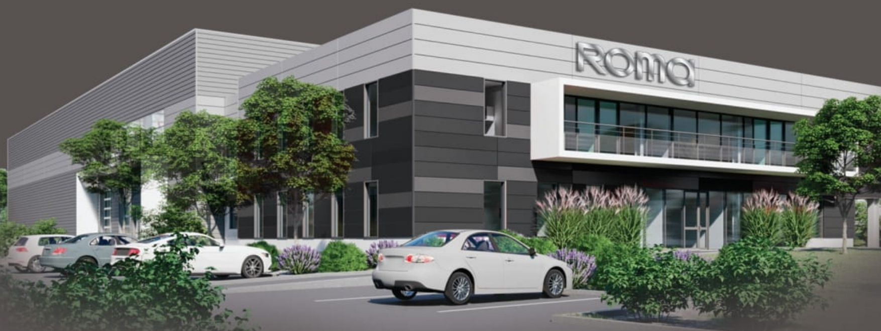
Siège ROMA FRANCE - Signes 83170 - Var